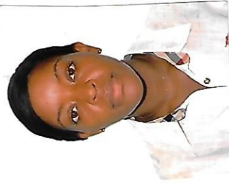
Assinatura do titular da cédula

O presente documento de identidade profissional, emitido nos termos do art.º 101.º do Estatuto da Ordem dos Advogados, aprovado pelo Decreto n.º 28/96, de 13 de Setembro, constitui prova da inscrição na Ordem dos Advogados como advogado estagiário e habilita o seu titular a exercer a profissão de advogado, nos limites previstos naquele Estatuto, em todo o território da República de Angola.